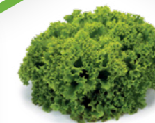
SALÁT LISTOVÝ LANDAU