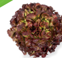
SALÁT DUBÁČEK COUSTEAU