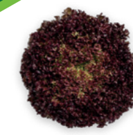
SALÁT LISTOVÝ CARMESI