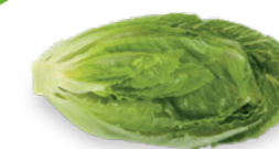
SALÁT ŘÍMSKÝ CRUNCHITA